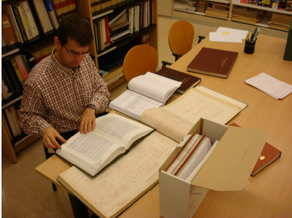
La recerca sobre fonts primàries és primordial per a la recerca de la història de les entitats. AMVA, Fons Ajuntament de Viladecans