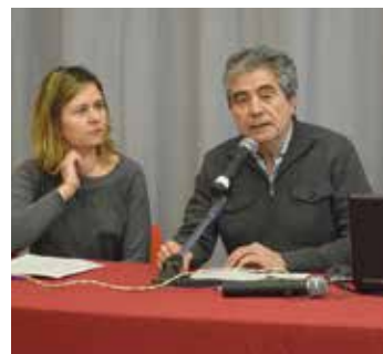
El regidor de Medi Ambient a l'acte

L'Ajuntament ha incorporat en el servei 'Que giri la joguina', de Viladecans Repara, vuit jocs fets amb materials reciclats, que ofereix a les escoles en préstec per fer-los servir en festes i activitats.