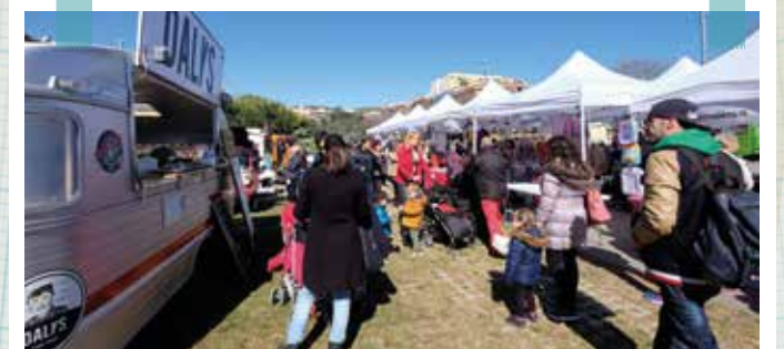
Xarxa Comercial va oferir una innovadora proposta per tancar les rebaixes acompanyada de la gastronomia de food trucks