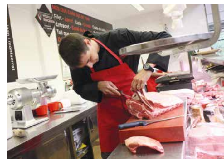
Una persona desempleada beneficiada por el Fem Feina en 2014

38% DE CONTRATOS INDEFINIDOS Siete de cada diez personas contratadas en la última convocatoria del proyecto seguían trabajando después de haber acabado la vigencia de la subvención, según un análisis realizado en febrero entre todas las personas contratadas con estas ayudas. Este estudio constata, así, el valor reinsertión en el mercado la-