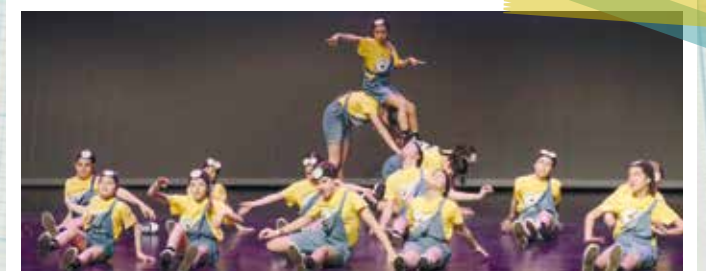
Els primers Premis Coreogràfics de Viladecans, organitzats per l'entitat Dreambox, van omplir Atrium de joves ballarins