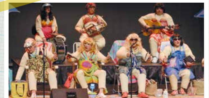
Les entitats Raíces de Andalucía i Peña Bética van portar les populars chirigotes de Cadis a Atrium Viladecans un any més