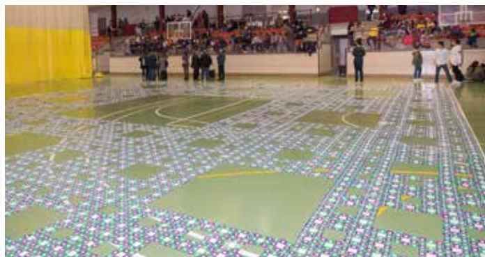
El pavelló del Col·legi Sant Gabriel va reunir el treball de 4.000 alumnes