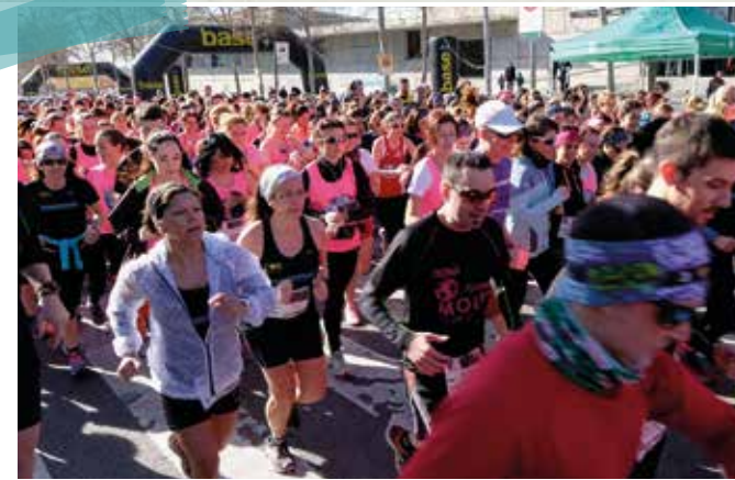
La segona Cursa de les Dones, organitzada per l'Ajuntament amb el suport de Running, va comptar amb més de 300 participants