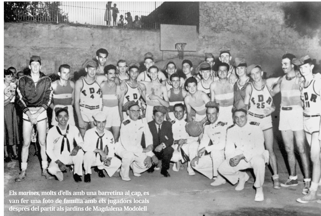
Els marines, molts d'ells amb una barretina al cap, es van fer una foto de família amb els jugadors locals després del partit als jardins de Magdalena Modolell

@FVamo 2 ABRIL Disfrutando de campeonato vogueing en Atrium #viladecans