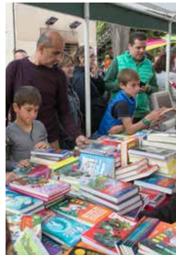
Parada de llibres al carrer Sant Joan

Diada. Nombroses activitats amenitzen la cita