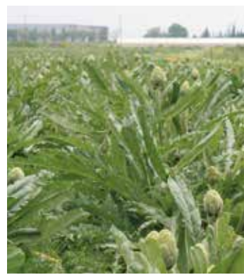
El clima suau de l'hivern ha afectat els cultius de carxofes

CONSULTA EL DOCUMENT ÍNTEGRE viladecans.cat