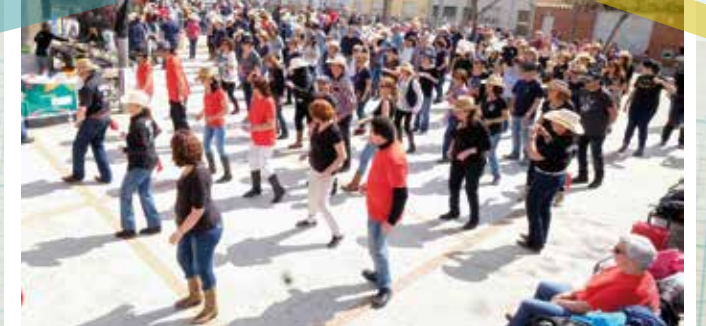
Més d'un centenar de ballarins en la 4a Trobada de country de l'associació veïnal de l'Alba-rosa, que va acabar amb una botifarrada