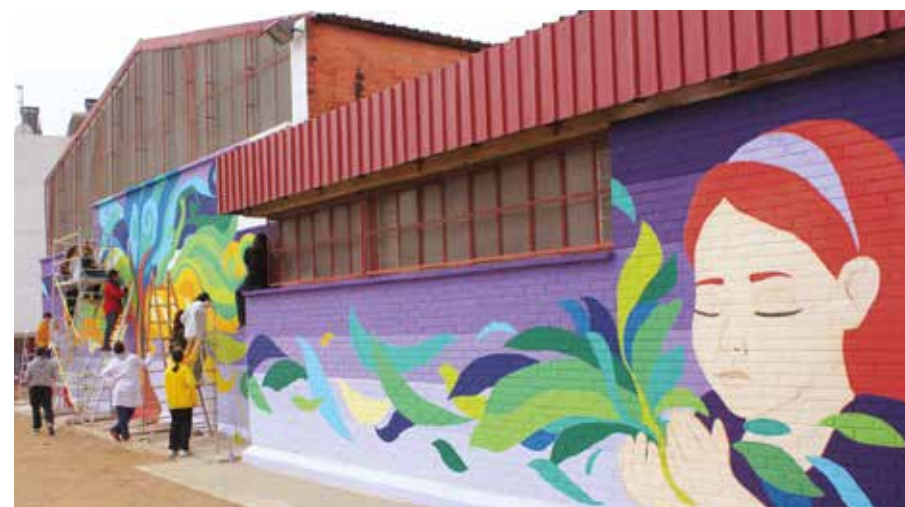
Alumnat de l'Institut Josep Mestres ultima el mural al pavelló esportiu de l'Escola El Garrofer

Quaranta alumnes dels Batxillerats Artístic i Tecnològic de l'Institut Josep Mestres i Busquets van pintar durant el març un gran mural a la paret del gimnàs de l'Escola El Garrofer. La iniciativa dona l'oportunitat als estudiants de traslladar les seves habilitats de dibuix del paper a la paret tot treballant en grans formats i en equip, alhora que suposa una millora per al centre escolar, que fa més atractiu el seu edifici. L'institut ja ha fet altres murals amb l'alumnat en cursos anteriors a les escoles Enxaneta i Àngela Roca i a l'Ateneu de les Arts. ●