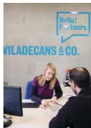
El servei està a Can Calderon

ELEVAT GRAU DE REINSEPCIÓ En les sis edicions acabades, el 95% dels participants van acreditar el programa i quatre de cada deu van continuar els estudis. ●