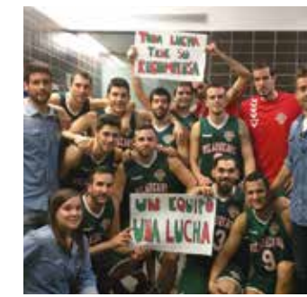
L'equip ja es va 'ficar' a la Copa