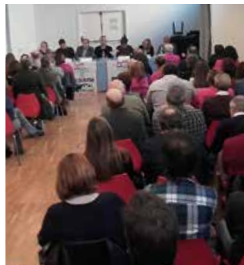
L'Ateneu es va omplir a vessar

Diputats del Parlament de sis formacions polítiques van reflexionar sobre el futur de l'hospital en un debat organitzat per la Plataforma en defensa del centre. Tots van defensar l'ampliació, però PSC, CUP i Catalunya Sí que es Pot van mostrar recels pel compliment dels terminis previstos. ●