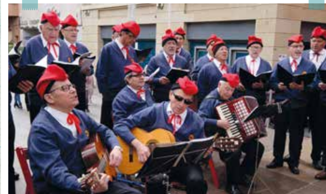
Les tradicionals caramelles van complir una dècada des de la seva recuperació amb un actuació plena de sàtira a la plaça de la Vila