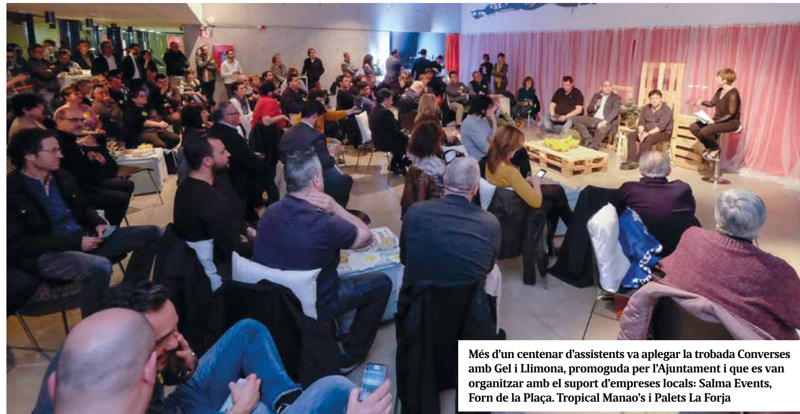
Més d'un centenar d'assistents va aplegar la trobada Converses amb Gel i Llimona , promoguda per l'Ajuntament i que es van organitzar amb el suport d'empreses locals: Salma Events, Forn de la Plaça. Tropical Manao's i Palets La Forja