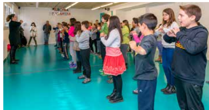
Professors del centre d'arts van impartir una classe a l'alumnat del projecte

MIRA COM ELS VA QUEDAR LA CATIFA! youtube.com/AjuntamentViladecans