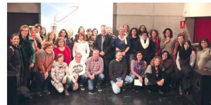
Alguns dels participants van fotografiar-se amb els ponents

La metodologia, els exàmens i els deures, centre de debat entre la comunitat educativa