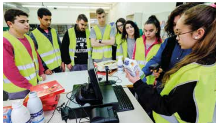
L'alumnat té una aula adaptada per al treball teòric-pràctic

A més de formar les persones participants en una professió, es fa un acompanyament individualitzat per a la millora de les competències i hàbits personals per accedir al mercat de treball. Durant el programa, els i les joves també pre-