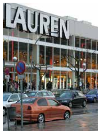
Els cinemes van tancar fa tres anys

La ciutat demana la col·laboració de l'Institut Català de Finances (ICF), propietat de la Generalitat, per desencallar la paràlisi que pateix la recuperació dels cinemes. L'empresa local STP Group fa molts mesos que intenta posar en marxa de nou l'equipament –tancat des del 4 març del 2013 quan l'exhibidora Lauren va entrar en fallida econòmica–, però s'ha topat amb el problema de la fragmentació de la propietat de les sales, que està en mans de set entitats financeres.