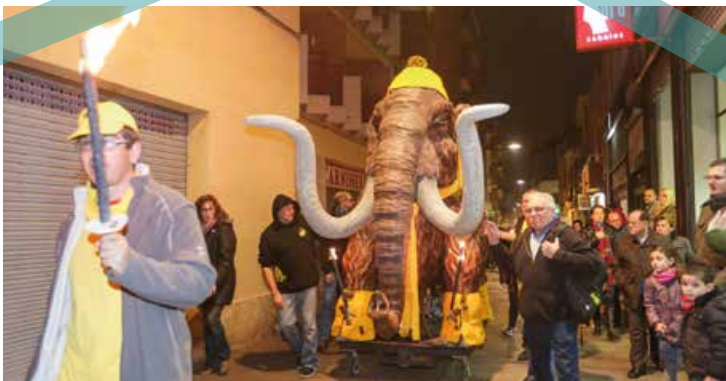
El Mamut va ser un dels protagonistes del Fest'hivern 2016