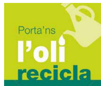
Imatge de la campanya de recollida

Un litre d'oli pot contaminar mil litres d'aigua, i fa més car i complicat el procés de depuració, a més de deteriorar les canonades i la xarxa de clavegueram. En canvi, si es recicla, es pot ob-