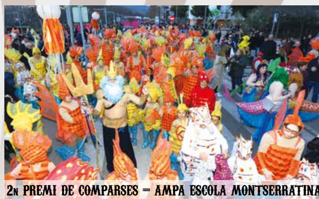
2n PREMI DE COMPARSES — AMPA ESCOLA MONTSERRATINA