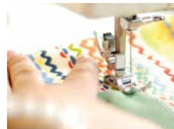
Una màquina de cosir, a disposició

Per fomentar la reparació, la reutilització i la reducció de residus, Viladecans Repara també fa tallers i ofereix un servei de préstec