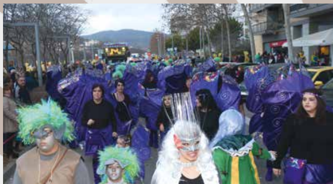
1r PREMI DE CARROSSES — LES AMPA AMAT TARGA I TORRE ROJA