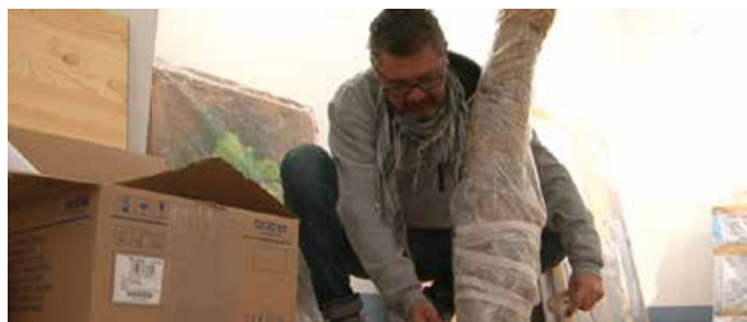
Un participant en un pla d'ocupació iniciat al 2015 fa tasques al Museu