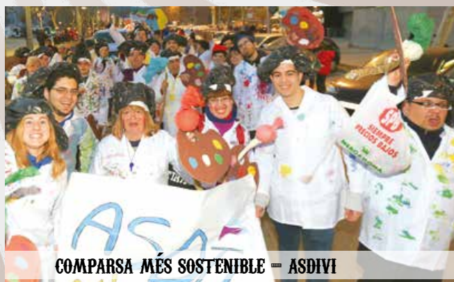
COMPARSA MÉS SOSTENIBLE — ASDIVI

Totes les fotografies de la rua, a la pàgina de Flickr de l'Ajuntament: www.flickr/photos/viladecans