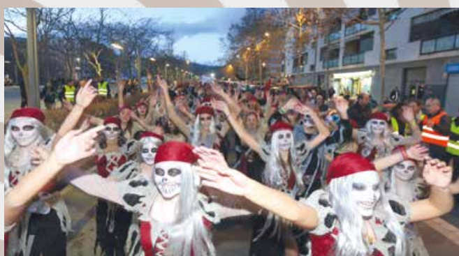
2n PREMI DE CARROSSES — AMPA COL·LEGI GOAR