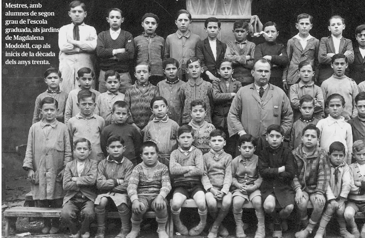
Mestres, amb alumnes de segon grau de l'escola graduada, als jardins de Magdalena Modolell, cap als inicis de la dècada dels anys trenta.

EN EL PROPER NÚMERO CONTINUAREM SEGUINT L'ETIQUETA #Viladecans