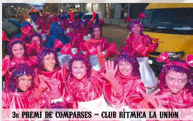
3r PREMI DE COMPARSES — CLUB RÍTMICA LA UNIÓ