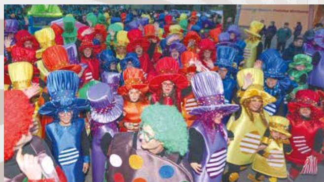
3r PREMI DE CARROSSES — AMPA ESCOLA PAU CASALS