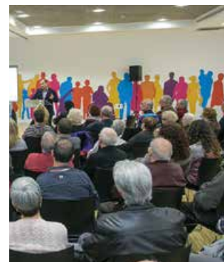
Audiència Pública del 2015

El Govern Municipal presentarà a la ciutadania en Audiència Pública, el 17 de febrer, el pressupost de l'Ajuntament d'enguany. L'acte tindrà lloc a Atrium Viladecans a les 19.30 hores. L'audiència és oberta a tothom que vulgui informar-se o resoldre dubtes, així com traslladar al Govern Municipal les seves propostes. Abans, a les 18.30 hores, es constituïran els tres Consells de Districte.