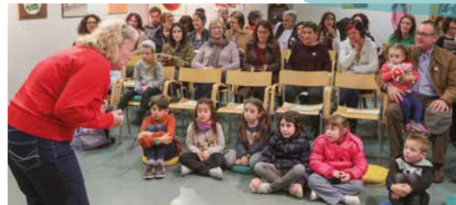
Grans i petits van escoltar narracions al 2n Festival Narracans