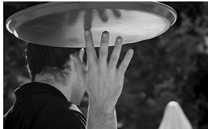
Fem feina a Viladecans ayuda a los desempleados a tener un trabajo

En las tres ediciones anteriores, impulsada entre 2013 y 2015, Fem feina a Viladecans ha contribuido a la contratación de 81 personas de la ciudad desempleadas por parte de empresas y a la puesta en marcha de 89 nuevas iniciativas de negocio de viladecanenses. ●