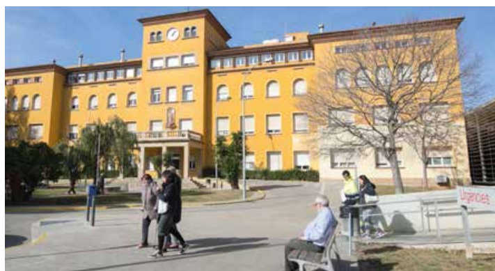
L'hospital és el referent per a prop de 200.000 veïns de la comarca