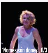
'Només són dones', 6/3