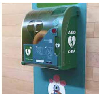
El desfibrillador instal·lat a Atrium

Per cada minut de demora en atendre una emergència d'aquest tipus i restablir la funció normal del cor, es redueix un 10% la pro-