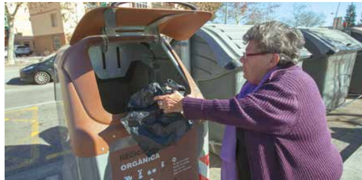
Los containers son más higiénicos pues se abren con el pie

Los nuevos contenedores tienen un sistema de apertura con el pie, como el resto de contenedores, por lo que su uso es más fácil e higiénico y, además, disponen de 1.800 litros de capacidad, frente a los 240 de los cubos que había hasta ahora. Su mayor tamaño,