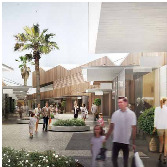
Imatge virtual del futur centre comercial outlet, que obrirà a la tardor

La iniciativa ofereix una formació professionalitzadora, amb 250 hores lectives i 80 de pràctiques, a més de fomentar la posterior inserció laboral amb una subvenció de 400 euros mensuals de fins a sis mesos, que es pot sol·licitar fins al juny. L'objectiu és que trobin feina mig centenar de persones en atur, sobretot les que no tenen subsidi laboral. El centre municipal Can Calderon seleccionarà els perfils, tot prioritzant els majors de 45 anys, les dones i els menors de 30 anys. ●