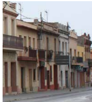
Viviendes de l'av. Generalitat

L'Ajuntament ha ampliat fins al 29 de febrer el termini d'allegacions al pla de renovació del polígon i va realitzar durant el gener noves