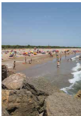
La platja, des de l'espigó

Aquest reconeixement se suma a la bandera de Platges Verges , atorgada per Ecologistes en Acció a les platges locals del Remolar i Cal Francès, per la qual el nostre litoral rep l'aval a la correcta combinació entre els serveis a la ciutadania i el respecte mediambiental.