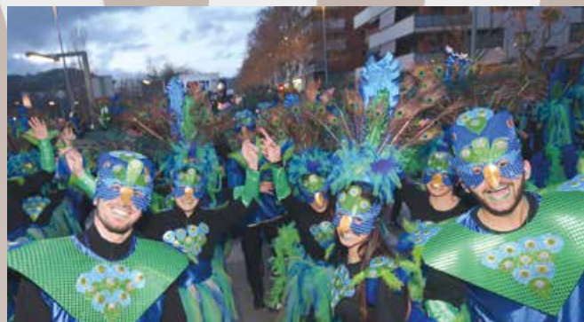
1r PREMI DE COMPARSES — AMPA COL·LEGI SANT GABRIEL