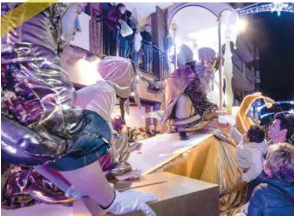
La Cavalcada de Ses Majestats d'Orient va fer les delícies dels petits en la Nit de Reis