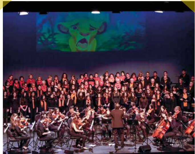
Vibrant concert músic-coral del Rei Lleó, promogut per La Lira