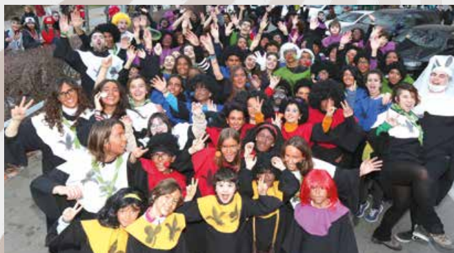
CARROSSA MÉS SOSTENIBLE — AEIG L'ESPIGA