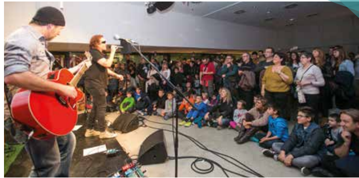
Més d'una vintena de grups, al concert solidari Els Músics són els Reis

VEIEU EL VÍDEO EN EL CANAL DE YOUTUBE DE L'AJUNTAMENT