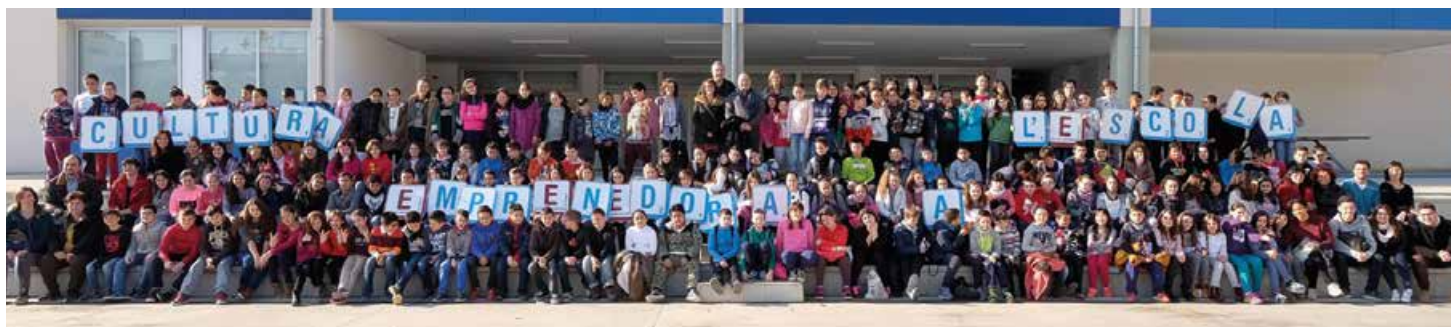
Les set classes de cinquè de les escoles Montserratina, Can Palmer, Enxaneta i El Garrofer, en l'acte de presentació