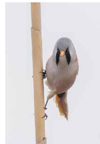
L'ocell avistat

De fet, aquest ocell està en perill de desaparició a Catalunya, on nidifiquen menys de 100 exemplars adults, sobretot al pantà d'Utxesa (Lleida) i al delta de l'Ebre, ja que es reproduïx formant colònies en canyissars de zones humides, com altres aus protegides com l'arpella, l'agró roig o el bitó. ●